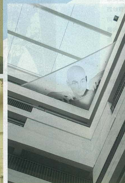
▲ 超大型作品《遠距觀照》，從平台往上看，極具視覺效果。