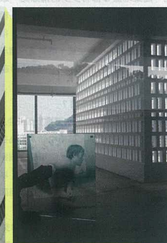
◀ 立體雕塑作品《殘型》。